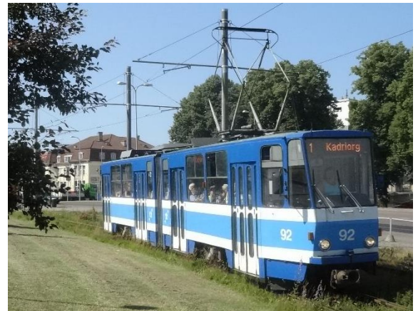
Beschleunigung des ÖPNV in Tallinn mit besonderem Bahnkörper für die Straßenbahn

kommt zu einer Verlagerung innerhalb des Umweltverbands und die angedachten positiven Effekte für den Klimaschutz fallen - entsprechend den örtlichen Gegebenheiten - kleiner aus als gedacht.