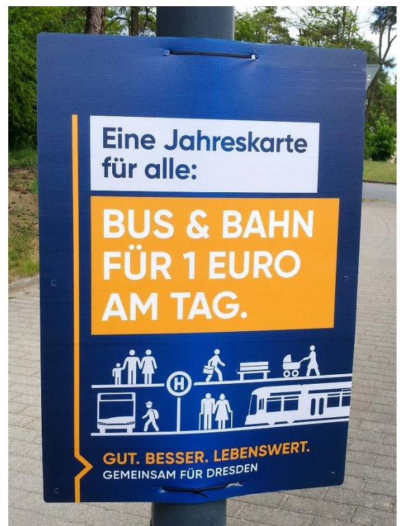
Das 365-Euro-Ticket ist Thema im Wahlkampf

Bevor Tarifsenkungen umgesetzt werden, müssen die öffentlichen Mittel im ersten Schritt vorrangig in Ausbau von Angebot, Kapazitäten und Qualität investiert werden. Hierfür gilt es, die derzeit vorhandenen finanziellen Spielräume in den Haushalten von Bund und Ländern zu nutzen und zusätzliche Mittel für Aus- und Neubau sowie die Grunderneuerung des ÖPNV zur Verfügung zu stellen.